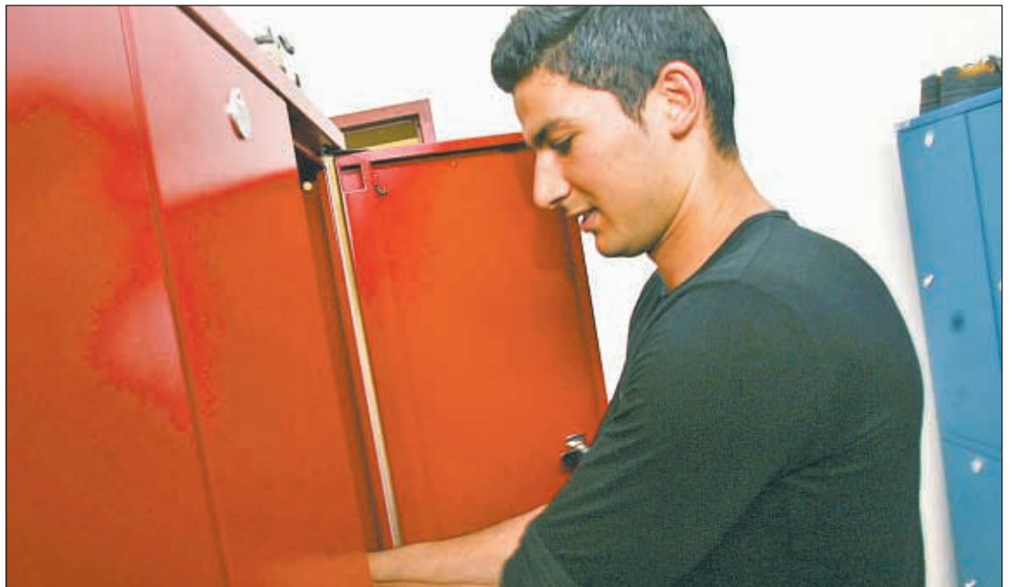
Der Verlust des Arbeitsplatzes schafft nicht nur oft rechtliche, sondern auch menschliche Probleme.

ist der Konkurs eines AN für ein Dienstverhältnis grundsätzlich bedeutungslos; unter besonderen Umständen kann jedoch ein solches Ereignis den Verlust der Vertrauenswürdigkeit des AN zur Folge