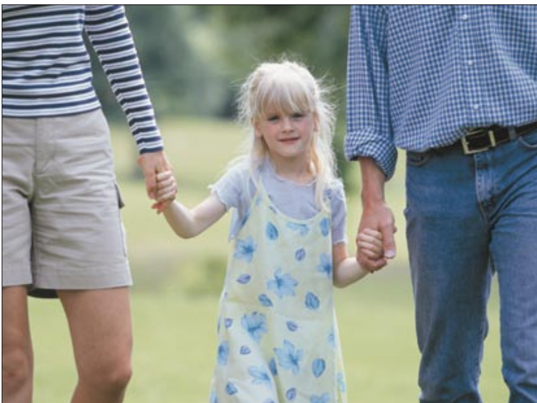
Zum Geldunterhalt wird nach dem Gesetz der Elternteil verpflichtet, der mit den Kindern nicht in Hausgemeinschaft lebt.

Die Rechtssprechung entwickelte daher Belastungsgrenzen. Ein gewisser Einkommensteil sollte dem Unterhaltsschuldner jedenfalls zur Deckung seines eigenen Lebensbedarfes verbleiben. Die Grenze ist aber sehr niedriger angesetzt. Die Rechtssprechung orientiert sich bei der Höhe der Belastungsgrenze am Unterhalts-Existenzminimum. Wobei ich betonen möchte, dass es sich hierbei um einen reinen Orientierungswert handelt. Im Jahre 2006 hätte diese Belastungsgrenze monatlich 604 Euro betragen, im Jahre 2007 beträgt sie 635 Euro/Monat. Die Sonderzahlungen müssen jedoch auf die zwölf Monate verteilt werden.