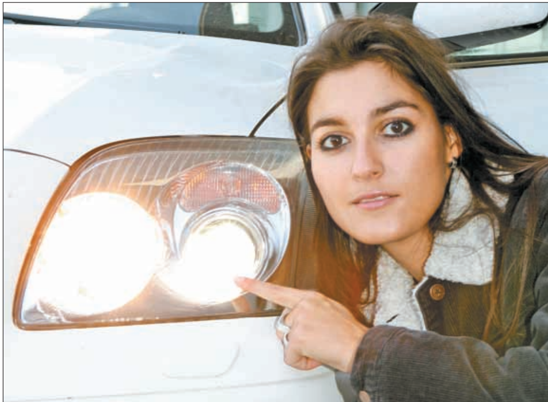
„Lichtmuffeln“ drohen nicht nur Verwaltungsstrafen.

Wie den Medien unlängst zu entnehmen war, sind auch in Vorarlberg viele Autofahrer als „Lichtmuffel“ unterwegs. Seit 15. November 2005 ist in Österreich aufgrund einer Änderung des Kraftfahrzeuggesetzes auch für mehrspurige Fahrzeuge das Einschalten des Abblendlichtes oder eines speziellen Tagfahrlichtes vorgeschrieben und zwar auch dann, wenn keine Sichtbehinderung durch Regen, Schneefall oder Nebel vorliegt. Nach einem straflosen Übergangszeitraum werden bei Verstößen seit Mitte April Verwaltungsstrafen in der Höhe von zumindest 15 Euro verhängt.